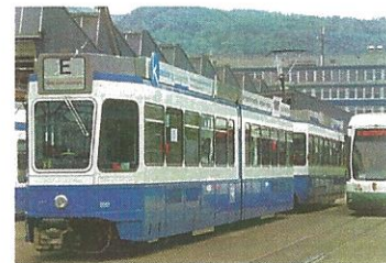
Meine Leidenschaft: Das Bild aus dem Jahr 2010 zeigt eine Cityflex 882 der SWA neben der Ponytram 2001 der Zürichlinie.

war – mein liebstes Fahrzeug. Und in Zürich hat man sich entschieden, diese schönen Fahrzeuge anzuschaffen. Basel bekommt jetzt 61 Stück und auch in Wien will man diesen Fahrzeugtyp kaufen. Das Flexcity Outlook Tram, wie die Bezeichnung von Bombardier heißt, ist inzwischen die meist verkaufte Straßenbahn. Seit Alfred Schmidt (Leiter der Lokalredaktion der Ausburger Allgemeinen) im TW 883 eine Testfahrt absolvieren konnte, ist mir auch dieser TW ans Herz gewachsen. Und wir würden uns freuen, für unsere Erlebnis-M8C-Sonderfahrt auch Vertreter der Presse begrüßen zu dürfen.