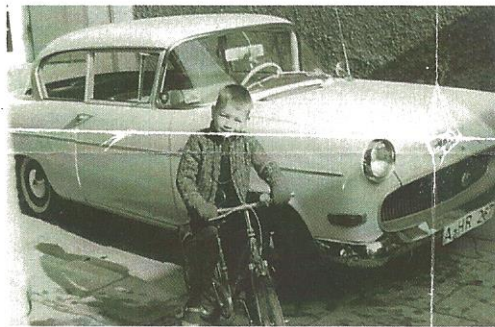
Fahren ist meine Leidenschaft, wie das Bild aus dem Jahr 1965 mit meinem ersten Fahrrad vor dem Auto meines Vaters – einem Opel Olympia – beweist.