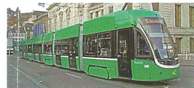
Die erste neue Tram 5001 für die Stadt Basel wurde auf den schönen Namen Basilisk getauft.

Parallel dazu kann an diesem Tag bei einer Turmbesteigung Augsburg von der Ulrichskirche aus fotografiert werden (Anmeldung für die Turmbesteigung unter: manfredschmidt1959@hotmail.com oder 0171 / 7208588) Um 14:05 Uhr, 15:05 Uhr und 16:05 Uhr finden noch drei öffentliche Rundfahrten im TW 506 ab Königsplatz Bahnsteig B2 statt. Natürlich hat man als Stra-