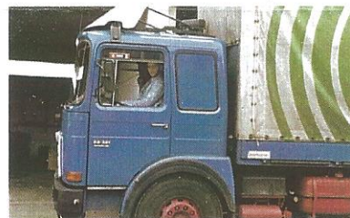
Auch mit Lkw's war ich viel unterwegs: Das Bild aus dem Jahr 1985 zeigt das Führerhaus eines MAN-Fernverkehrstrucks.

Um zu zeigen, was man mit der Straßenbahn für schöne Dinge erleben kann, veranstalten wir, die Freunde der Ausburger Straßenbahn (Infos im Internet unter www.f-d-a-s.de ), eine Erlebnis-M8C-Sonderfahrt in Augsburg am Samstag, 3. Oktober, von 15-18 Uhr, zu der wir alle Interessierten einladen.